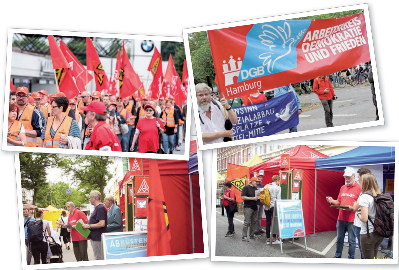
Impressionen der AGA im IG Metall Bezirk Küste

Bündnispartner:innen, wie zum Beispiel dem Sozialverband Deutschland oder dem Verein Dau wat (plattdeutsch für „Tu was“, eine gewerkschaftliche Erwerbslosenvertretung im Raum Rostock). Auch mit Stadtteilinitiativen, Initiativen für Frieden oder gegen rechts wird der Austausch gesucht. In allen fünf Bundesländern der Küste arbeiten die Senior:innen in den Senior:innenbeiräten im Rahmen der jeweiligen Senior:innenmitwirkungsgesetze mit.