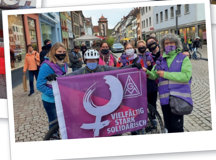
Impressionen der AGA im IG Metall Bezirk Baden-Württemberg

felder aktiv mit. Sie greifen Probleme auf, die im Alltag der Senior:innen bestehen und entwickeln auf regionaler Ebene Lösungsansätze dafür.