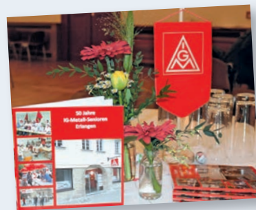
seit über 50 Jahren