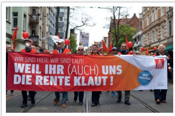
AGA Hannover auf der Demo zum 1. Mai 2022

Unter dem Dach der AGA Hannover läuft das Projekt „Metaller helfen Metallern“: Seit über zwölf Jahren unterstützen ehrenamtliche Kolleginnen und Kollegen dort erwerbslose Mitglieder bei der Suche nach einem neuen Arbeitsplatz. Sie helfen bei der Bewerbung, geben Tipps für Bewerbungsgespräche und nutzen ein umfassendes Netzwerk mit Betriebsräten und Vertrauensleuten, um Jobs zu vermitteln. Eine weitere Fachgruppe gibt es zum Thema Rente. Sie berät Mitglieder in wöchentlichen Sprechstunden zu allen Rentenfragen, organisiert Infoveranstaltungen und gestaltet zweimal im Jahr das Seminar „Hinter dem Horizont – geht’s weiter“ sowie Schulungen für Betriebsräte und Schwerbehindertenvertretungen. Vier Senior:innengruppen ergänzen das Angebot mit Freizeitaktivitäten in verschiedenen Teilen der Region.