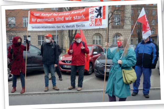
Impressionen der AGA im IG Metall Bezirk Berlin-Brandenburg-Sachsen